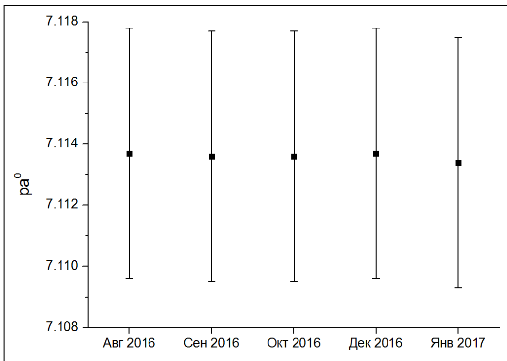
Рис. 2. Проверка долговременной стабильности образца

Выбор метода измерений, калибровочных стандартов, подготовка реактивов и оборудования были полностью оставлены на усмотрение участников. В ходе сличения участниками были использованы: первичный метод измерений (с использованием ячеек Харнеда), вторичный метод (дифференциальная потенциометрическая ячейка) и рабочий метод (измерительный преобразователь с комбинированным стеклянным электродом или с электродной системой, состоящей из электрода сравнения и стеклянного электрода). Подробное описание использованных методов соответствует описаниям в рекомендациях IUPAC от 2002 года [2].